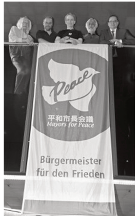
Mayor for Peace OB Thomas Kufen, ganz rechts

In Essen „hissten“ innerhalb des Essener Rathauses am 7.7.2017 Oberbürgermeister Thomas Kufen und Vertreter des Essener Friedensforum die Flagge. Thomas Kufen sagte: "Atomwaffen dürfen nie wieder zum Einsatz kommen. Es ist wichtig, hier ein eindeutiges und eindringliches Zeichen zu setzen sich gemeinsam für die weltweite nukleare Abrüstung und ein friedliches Zusammenleben zu engagieren. Auch in der heutigen Zeit, die aufgrund kriegerischer Auseinandersetzungen und Terrorismus aus den Fugen geraten scheint, darf es kein Zurück zu dieser unmenschlichen Waffe geben." (Homepage der Stadt Essen)