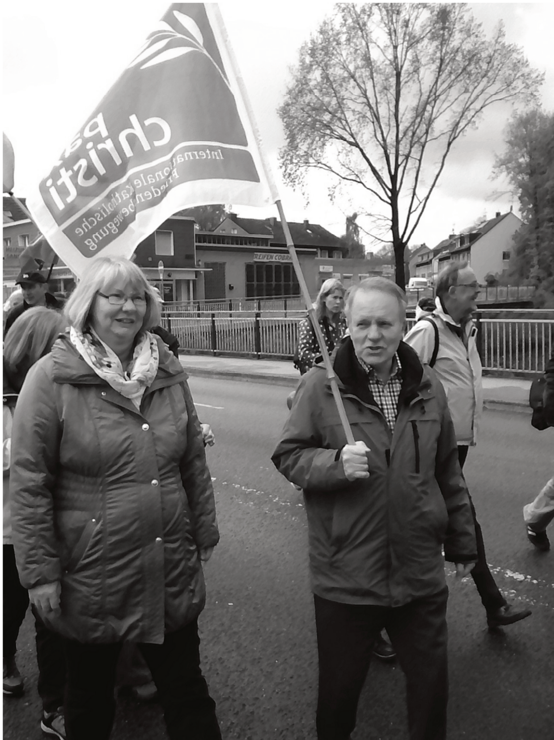
pax christi-Mitglieder beim Ostermarsch in Bochum